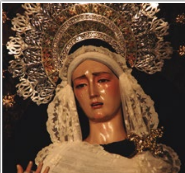
Imagen Titular: Virgen de los Dolores (Antonio Castillo Lastrucci, 1940).

Catedral 21:30h. | Prado | Camarín | Pasaje Merced 22:00h. | Toledo | Feria | Mercado Viejo 22:35h. | Plaza Mayor | Cuchillería | Lanza | Cardenal Monescillo 23:35h. | Callejón Del Huerto | Paloma | Plaza Constitución | Jacinto | Toledo | Merced 1:00h. | Toledo | Feria | Prado | Entrada Catedral 2:15h.