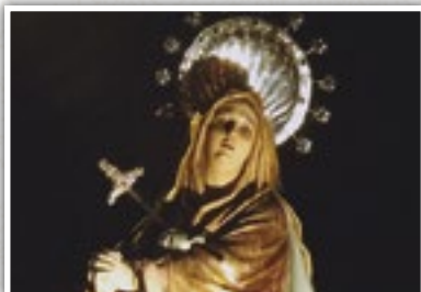
Imagen Titular: Virgen del Mayor Dolor (José María Rausell Montañana y Francisco Llorens Ferrer, 1944).

Salida De San Pedro 0:00h. | General Rey | Mata | Compas De Sto. Domingo 0:20h. | Lirio | Norte | Plaza De Santiago 1:10h. | Angel | Jacinto | Altargracia | Estrella | Elisa Cendrero | Calatrava | Toledo | Estación Via Crucis | Plaza Del Carmen | Azucena | Prado | Feria | Maria Cristina | Plaza Mayor | Cuchilleria | Ruiz Morote | Entrada San Pedro 3:15h.