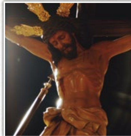
Imagen Titular: El Misterio representa la lanzada de Longinos a Cristo bajo la advocación de la Caridad (Claudio Rius Garrich, 1945).

Salida Guardapapos | Cañas 19:15h. | Paseo Stmo. Cristo De La Caridad 19:38h. | Lirio, Norte y Santiago 19:58h. | Altgracia 20:13h. | Estrella 20:28h. | Toledo | Estación Via Crucis 20:43h. | Plaza Del Carmen 21:08h. | Paseo Del Prado (Camarín) 21:35h. | Caballeros 21:53h. | Pasaje De La Merced 22:03h. | Toledo | María Cristina 22:33h. | Plaza Mayor 22:45h. | Cuchillería-Paloma 22:58h. | Paloma-Huertos 23:18h. | Huertos-Quevedo | 23:38h. | Entrada Guardapapos 0:08h.