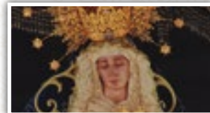
Imagen Titular: Virgen de los Dolores (Anónima, 1943).

Salida Guardapasos 20:00h. | Lirio, Norte y Santiago 20:30h. | Altagracia 21:00h. | Estrella 21:30 h. | Elisa Cendreras 22:00h. | Calatrava 22:30h. | Angel 22:50h. | Santiago (Hermanas De La Cruz) 23:00h. | Paseo Cristo De La Caridad 23:30h. | Cañas-Felipe II 23:45h. | Juan De Avila-Quevedo 0:00h. | Entrada Guardapasos 0:15h.