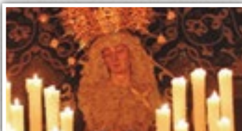
Imagen Titular: Virgen de los Dolores (Anónima, 1943).

Salida Guardapasos | Cañas 19:30h. | Paseo Stmo. Cristo De La Caridad 19:53h. | Lirio, Norte y Santiago 20:18h. | Altagracia 20:28h. | Estrella 20:43h. | Toledo | Estación Via Crucis 20:58h. | Plaza Del Carmen 21:23h. | Paseo Del Prado (Camarin) 21:55h. | Caballeros 22:08h. | Pasaje De La Merced 22:18h. | Toledo | María Cristina 22:48 | Plaza Mayor 23:05h. Cuchillería-Paloma 23:13h. | Paloma -Huertos 23:33 h. | Huertos-Quevedo 23:53h. | Entrada Guardapasos 0:23h.